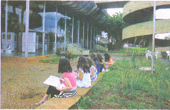
Alunas durante oficina realizada no Teatro Municipal

Desenvolvido com o objetivo de realizar uma ação concreta de defesa, resgate e preservação da história cultural, artística e arquitetônica dos municípios, o projeto Um Olhar Sobre a Cidade teve início, em Araraquara, no dia 1º de outubro. A ação, que contempla quatro oficinas culturais gratuitas para diferentes públicos, busca sensibilizar a população a ter um olhar mais cuidadoso com tudo que a cidade oferece.