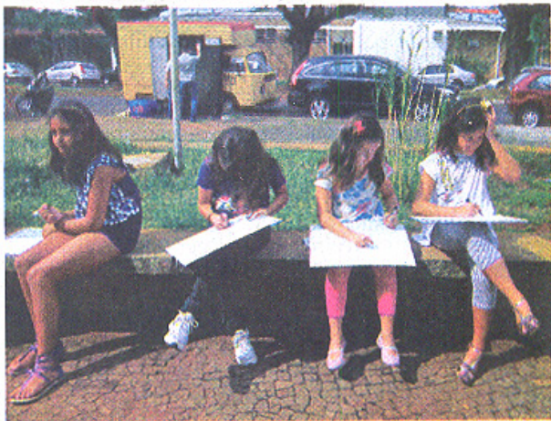
Alunas durante oficina realizada no Teatro Municipal