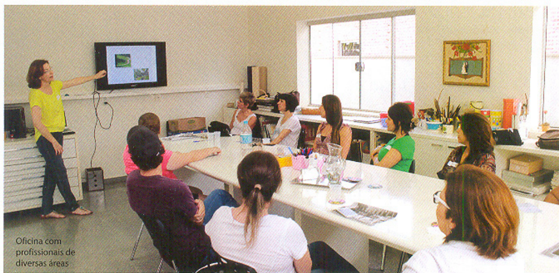
Oficina com profissionais de diversas áreas

projeto, realizado por meio de oficinas gratuitas. O tema dos encontros é o Teatro Municipal.