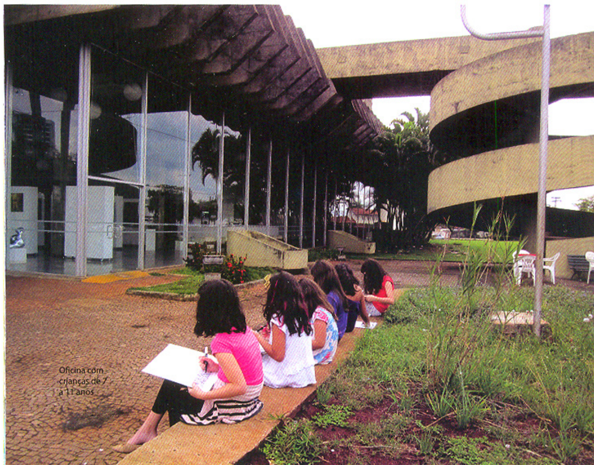
Oficina com crianças de 7 a 11 anos